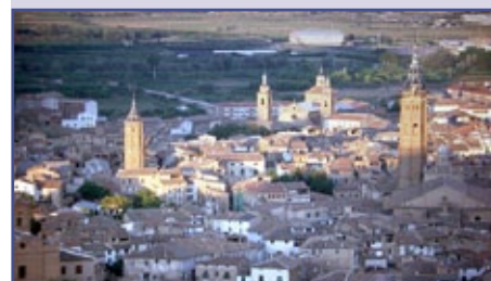
Vista de Calatayud

La Comarca Comunidad de Calatayud se encuentra situada en un punto estratégico muy importante a nivel nacional. Tomando de referencia la Capital de la Comarca, Calatayud, tenemos combinación tanto por carretera (A2, Madrid-Barcelona), como por tren (Ave, Madrid-Barcelona). A tan sólo 83 kilómetros contamos con Zaragoza y su Aeropuerto internacional. Destacar la cercanía y las buenas vías de comunicación que hay con Madrid, Bilbao e incluso Barcelona.