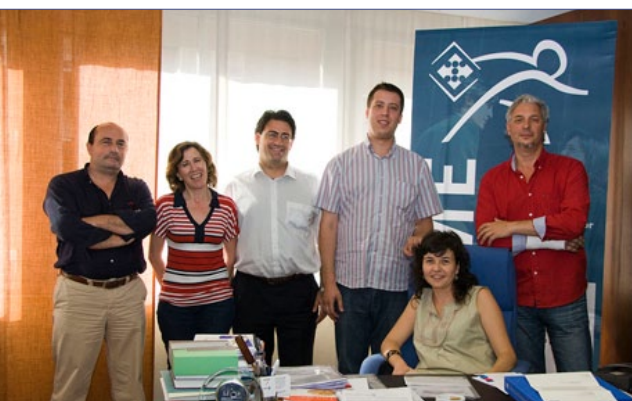
Equipo de técnicos del SACME

A las 10 de la mañana CREA y CEZ estimaron que la huelga fue apenas secundada por un 11.2 % de los trabajadores cifra que no aumentó a lo largo de la jornada. Cabe destacar la ausencia de incidencias reseñables, aunque se registraron retrasos en la entrada a las empresas de los trabajadores, que querían ejercer su derecho al trabajo a causa del corte de los principales accesos a los polígonos industriales. ■