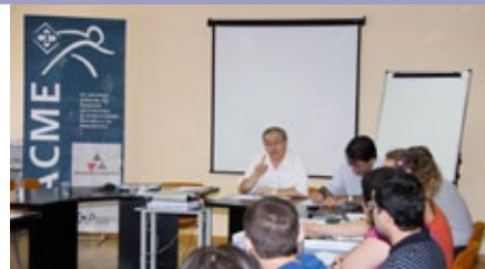
Jornadas formativas durante la 1ª Convocatoria de Iniciativa Municipal 2010.

Abiertas hasta el día 6 de octubre la Convocatoria Iniciativa Provincial y hasta el 3 de noviembre la Convocatoria Iniciativa Municipal.